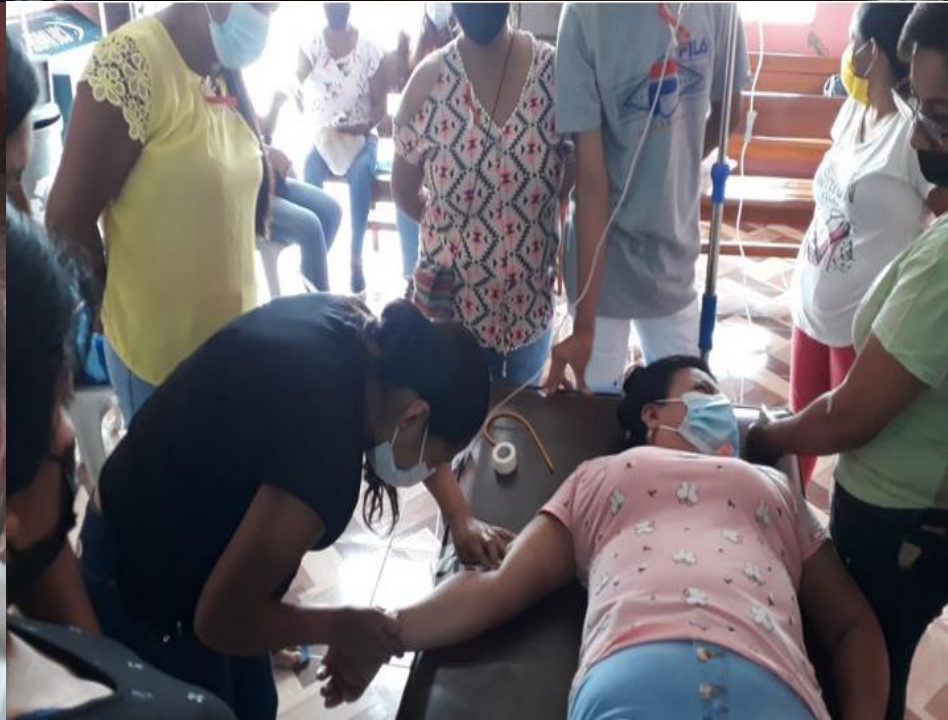
Curso Primeros Auxilios...