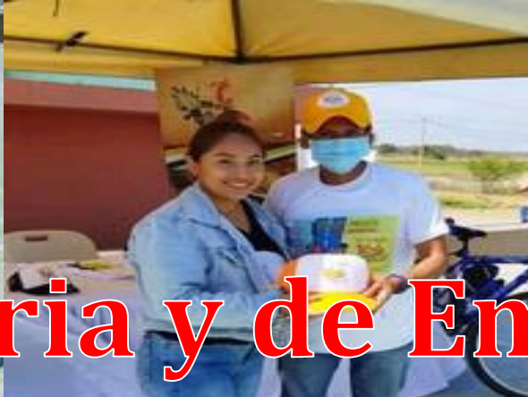
Feria Agropecuaria y de Emprendimiento...